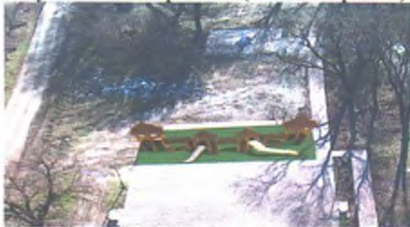
Фото до реализации проекта: